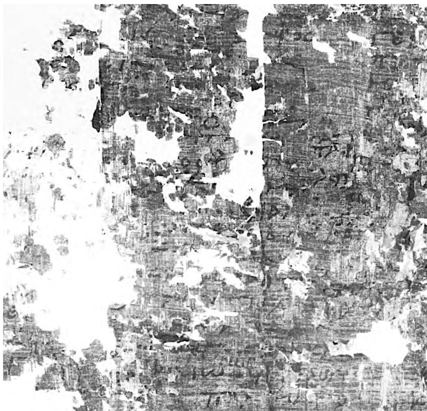
Abb. 1. P.Herc. 1021 (Multispektralbild MSI), Kol. 25, Z. 20-38.